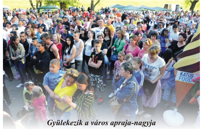
Gyülekeznek a város apraja-nagyja