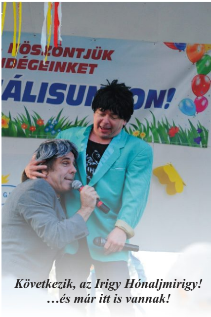
Következik, az Irigy Hónaljmirigy! ...és már itt is vannak!