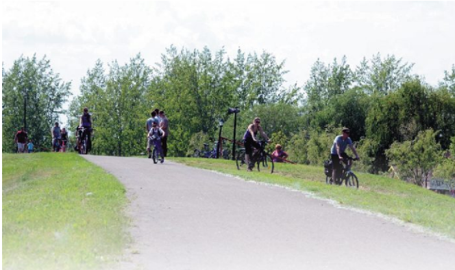
Az idő és a környezet csodálatos

Tanúsíthatom, remek nap volt ez! Rég nem látott vidám, önfelelt közönséggel, sztárvendégekkel, finom ételekkel, játékokkal pörgött a nap, melyet Kisköre Városi Önkormányzat és a Tisza Sunlight Club szervezett a megújult városi strandon! Több, mint 2000 ember volt résztvevője helyből és a térségből egyaránt, ennek a igazán fergeteges napnak!