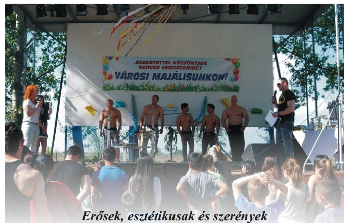
Erősek, esztétikusak és szerények