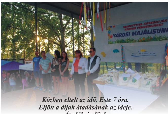
Közben eltelt az idő. Este 7 óra. Eljött a díjak átadásának az ideje. Atadók és díjak