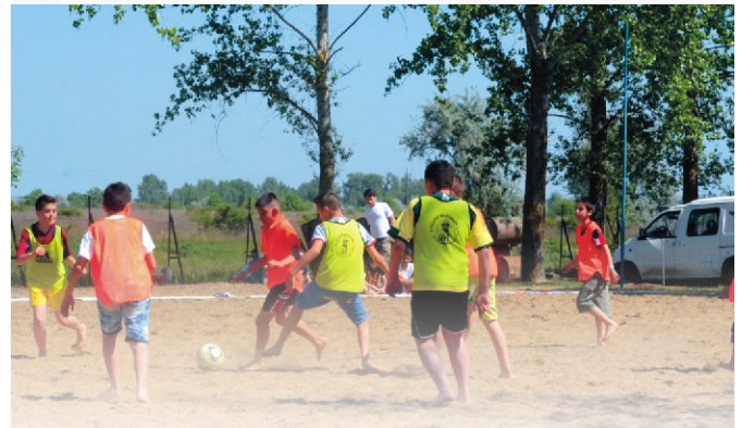
Van utánpótlás a homokfociban