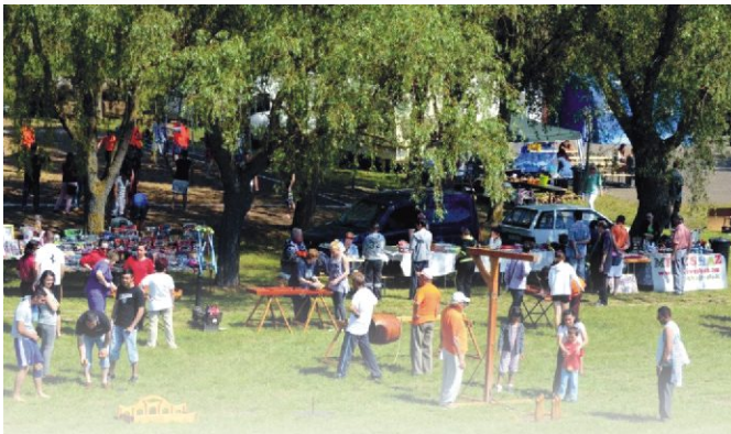
Az aktív időtöltés keretén belül számtalan versenyszámban mérhetik össze tudásukat az érdeklődők