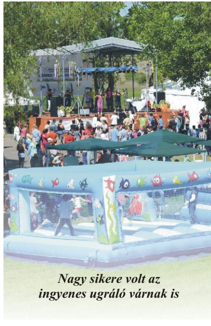
Nagy sikere volt az ingyenes ugráló várnak is