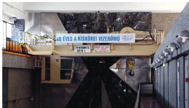
A vízerőmű 20/5 t daru, háttérben a JÉGZAJLÁS c. alkotás