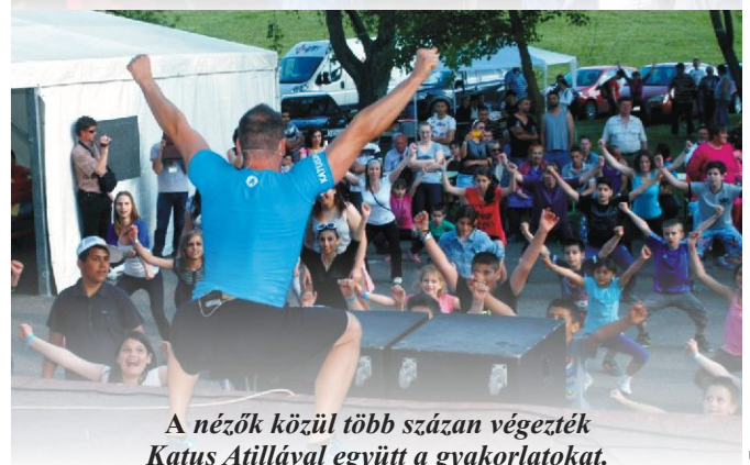
A nézők közül több százan végezték Katus Atillával együtt a gyakorlatokat.