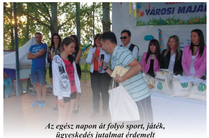
Az egész napon út folyó sport, játék, ügyeskedés jutalmat érdemelt