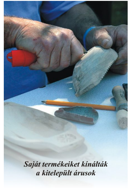
Saját termékeiket kínálták a kitelepült árusok