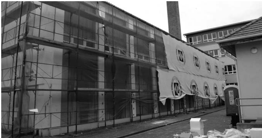
Zajlik a Vásárhelyi Pál Általános Iskola tornatermének energetikai korszerűsítése, a felállóanyagozott épület hőszigetelése történik.

A Városháza és a Városi Könyvtár napelemes rendszerének kialakítására Kis-köre Város Önkormányzata közel 21 millió forintos európai uniós támogatást kapott az Európai Regionális Fejlesztési Alaptól. A EU az elszámolható költségeket 100%-os intenzitással finanszírozza, a nem elszámolható költségeket pedig az önkormányzat saját erőből fedezi.