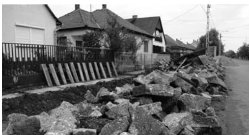
A köz munkások segítségével elkészült munka nyomán a Tisza II. lakótelepen már az új, minőségi járdán közlekedhetnek a járókelők, s a városközpont irányában is jól haladnak már az építéssel.